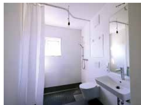
Modernes Badezimmer mit begehrter Duscheinheit