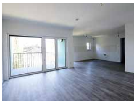
Wohn- und Essbereich in Kombination mit bereits gelegtem Fußboden