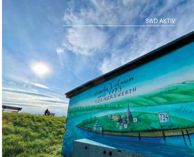
Wandbild - Insula Volmari

Ein paar hundert Meter weiter spenden große, alte Bäume angenehmen Schatten, sollte die Sonne im Sommer einmal zu sehr strahlen. Es treffen sich dort gern die Menschen zum Picknick mit einem Kohlegrill. Kein Problem für Lothar See. „Aber wir bitten im Namen der Anwohner und Natur, dass anschließend die Abfälle nicht liegen gelassen werden.“