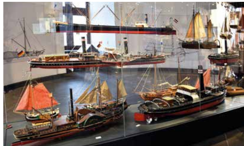
Schifffahrtsmuseum im Schlossturm

Mit dabei sind das Filmmuseum, das Goethe-Museum, das Heinrich-Heine-Institut, das Hetjens-Keramikmuseum, das Schifffahrtsmuseum im Schlossturm, das Stadtmuseum, das Schumann-Haus und das Theatrumuseum im Hofgartenhaus. Auch in der Kunsthalle und im KIT - Kunst im Tunnel ist am zweiten Sonntag im Monat der Eintritt frei. Die Ausstellung der Mahn- und Gedenkstätte können Interessierte jederzeit kostenlos besuchen.