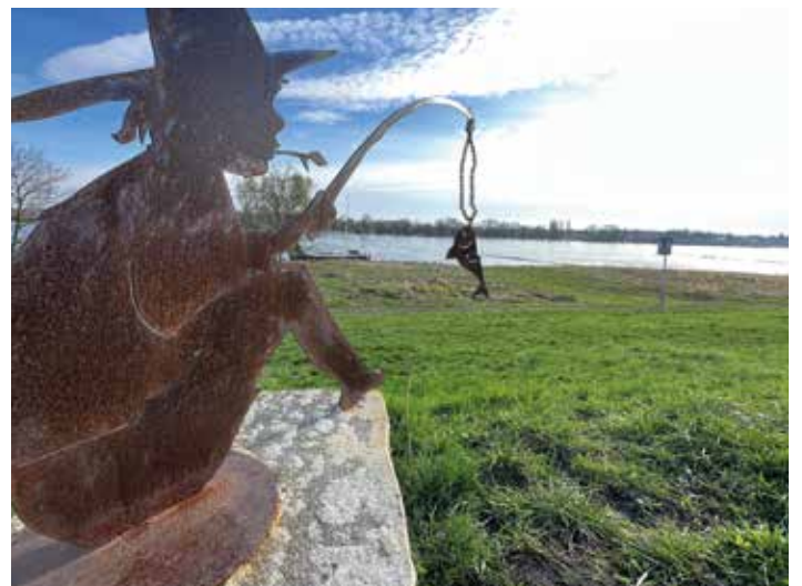
Metallskulptur - Der kleine Fischerjunge