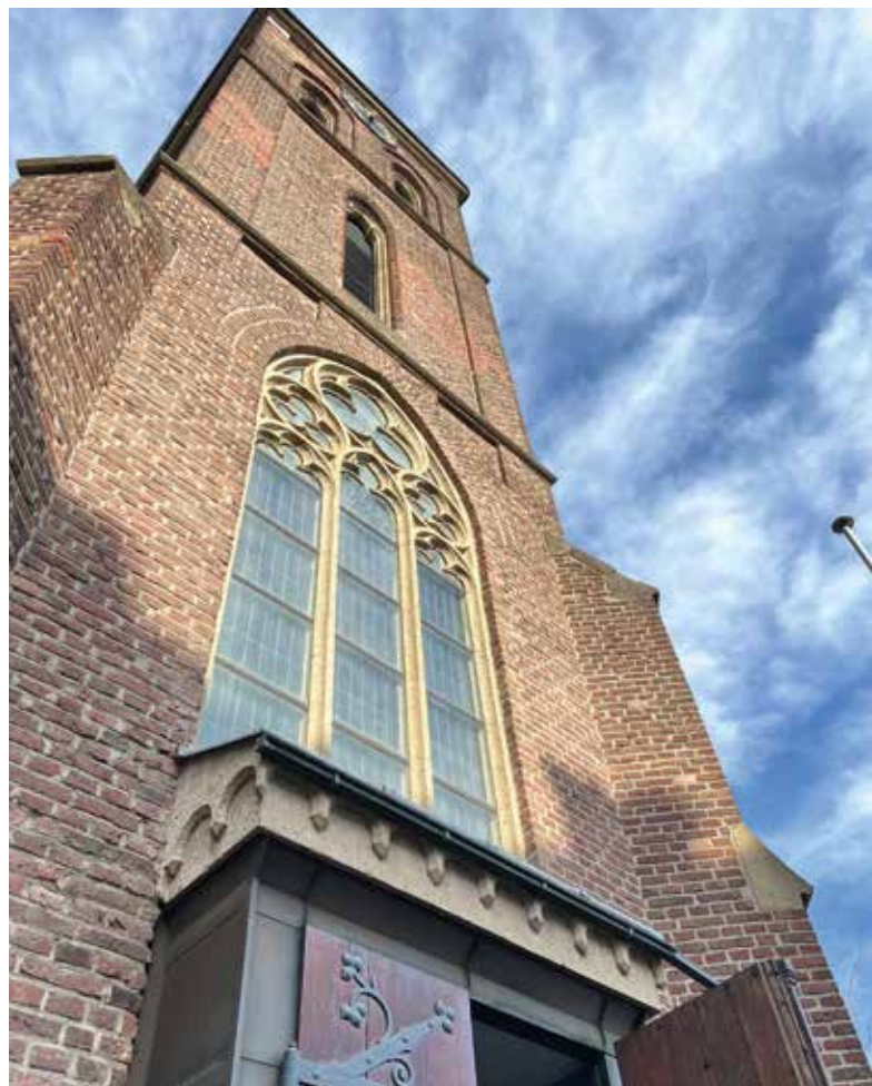
Kirche St. Dionysius